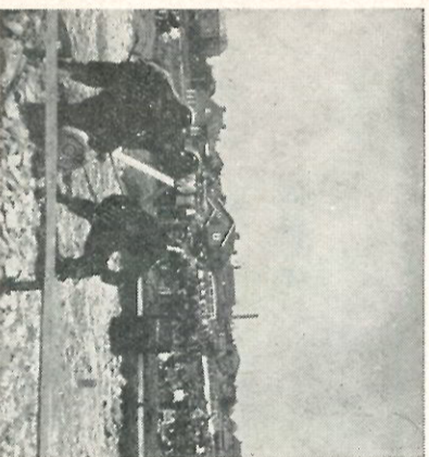
Altorens gebint kan worden, moet een brandverkenning plaats vinden. Op de rug ziet U de heren Perlee, Id- zingja en Kouwer.